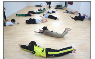
ピラティスの様子！ 体幹とインナーの筋肉を鍛えて綺麗な姿勢を目指します！