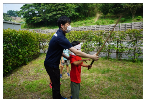
「いいか?」 とにかく真っすぐだ!