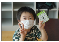
七夕会のビンゴ大会 やっほーい!