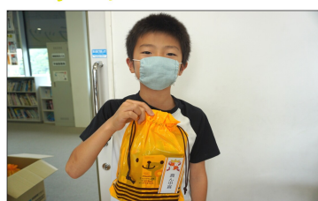
僕が真ん中賞でした