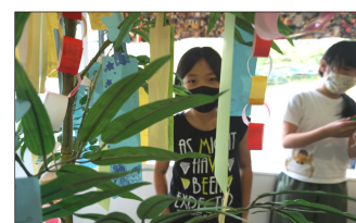
みいたあなあああ!!