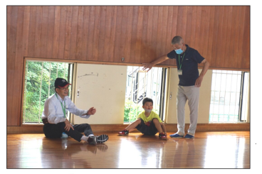
灼熱の井戸端会議