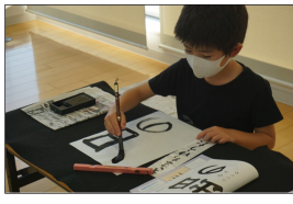
課題の「日の出」 いい顔してるうう!

今慣れたように筆を持つ高学年もみんな「初めて」がありました。これからのたくさん筆に触れて、楽しさを知ってほしいですね。