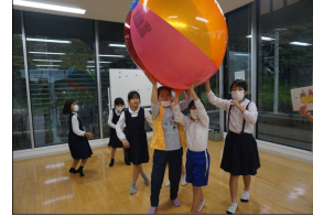
遊んでるんじゃない! これも勉強の一環!!