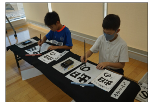
高学年は慣れてますなあ