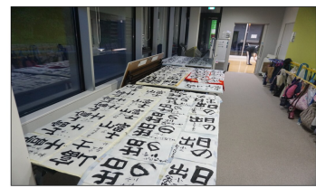
2~6年生となると 量もすごい!

今慣れたように筆を持つ高学年もみんな「初めて」がありました。これからのたくさん筆に触れて、楽しさを知ってほしいですね。