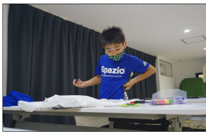
目つきも手つきもカ。

なかには、「当日まで見られないように隠して作るわ!」とこそこそ作ってる子も... (笑)