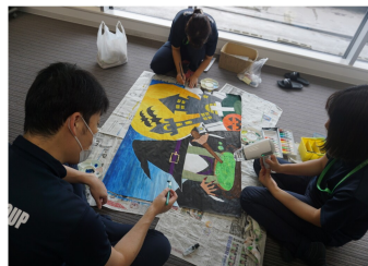
ドライヤーを駆使します