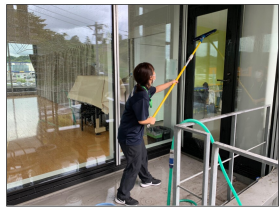
窓掃除中... 常に筋トレや!ハッ!

子どもたちは正直なので、今後の子供たちの反応で「成功」か「継続」か判断します(笑)