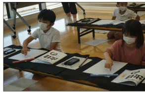
まずは指でイメトレ... ドキドキ...

え、え、その発言にドキドキしちゃう! とキョウキョウする先生を横に真剣な面持ちで座る子供たちです。