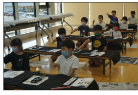
目を瞑って 書き順チェック