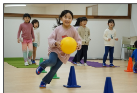
ボールを使ってバルシュー！