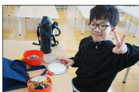
自慢のお弁当とピース